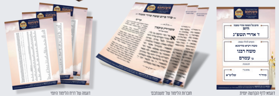
דוגמה של דו"ח הלימוד היומי