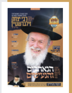
תמונת שער: הגר"י זילברשטיין

עיצוב סטודיו YES כתיבה יוסף מאיר האם היגוי והפקה ישראל מ. גפנר