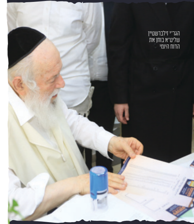
הגר"י זילברשטיין שליט"א בוחן את הדוח היומי

אב"ד שכונת רמת אלחנן בי"ב וחבר מועצת גדולי התורה