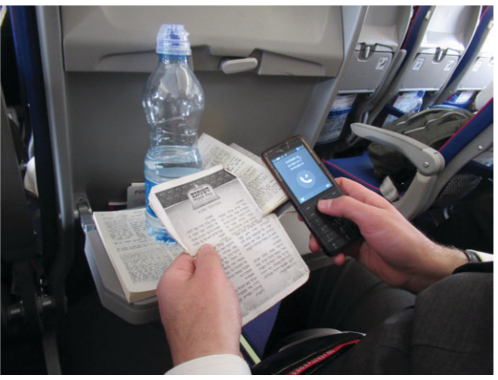
ובלכתך בדרך. מאשרים את לימוד הפרקים במערכת הטלפונית לאחר שחייעת השם לעיני

ששה סדרים ביום אחד מאז ומתמיד ידועה היתה בישראל סגולת לימוד המשניות לעילוי נשמה מן המובחר. רבים הם החפצים לסיים את כל ששת הסדרים לעילוי נשמות יקיריהם ע"ה, ביום השנה, בימי השבעה, ביום השלושים ובמשך שנת האבל, אך קשה עד בלתי אפשרי להגיע לסיים אותם תוך יום אחד. ראשי ארגון 'משנתכם' עולה למעלה! ראו לנוכח עיניהם את הצורך להקים מערך מבוסס שיתן מענה מקיף למשאלה הקיימת בלב רבים, צאצאים להורים וסבים המעוניינים לפעול לטובת נשמת הוריהם שהסתלקו לעולם שכולו טוב, וידידים המבקשים בטובת יקיריהם שהלכו לעולמם, והיא, לסיים את ש"ס משניות העומדת במעלה ראשונה לעילוי הנשמה בגנזי מרומים.