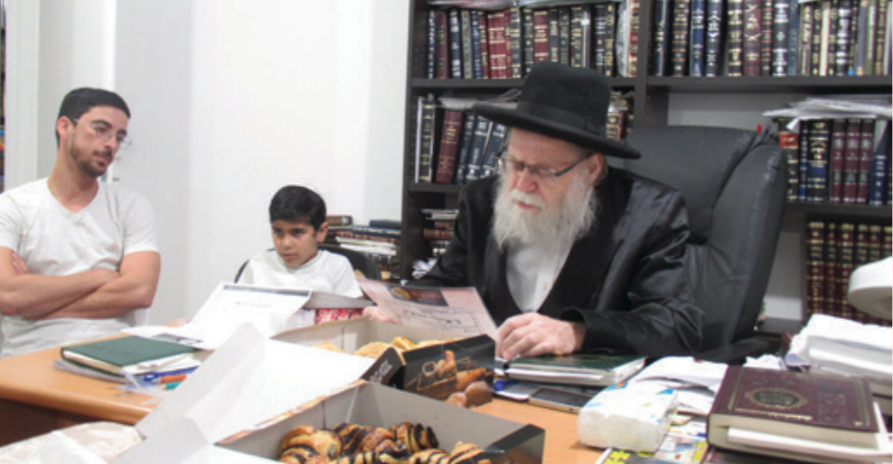
סיס ששה סדרי משנה לעילוי נשמות ההרואים בפיגוע הנורא באלעד הי"ד על ידי ארגון 'משנתכם' בבית המרא דאתרא הגרש"ז גרוסמן שליט"א