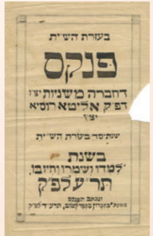
פנקס חברת משניות דק"ק אלטא ברוסיה שנת תר"ע