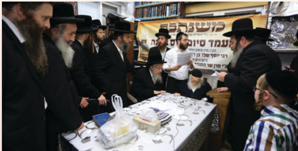
מעמד סיום ש"ס משניות שנערך ע"י 'משנתכם' בבית מדרש התורה הגר"ח קנייבסקי זצוק"ל לע"נ חותנו מרן הגר"ש אלישיב זצוק"ל

אחד הגורמים הטובים ביותר לעילוי נשמת הנפטר הוא לימוד התורה ובמיוחד לימוד משניות. לימוד תורה בכלל ולימוד משניות בפרט בשנה הראשונה לפטירה, וביום האזכרה (יום השנה / יארצייט) מועיל במיוחד לעילוי נשמה של הנפטר ולהכנסתו לגן עדן, שכן נאמר בספרים