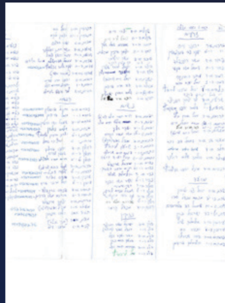
רשימת לוחי המשניות בארגון 'משנתכם' בתקופת הרישום הידני לפני הקמת המערכת המשובלת