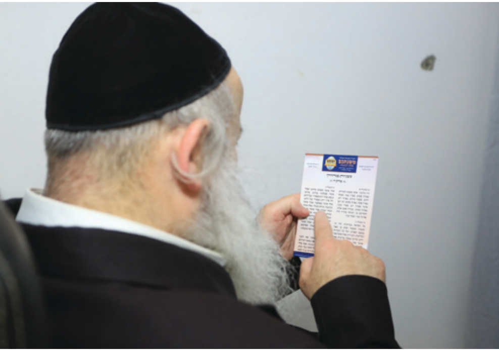
הגיס ומתמידים בלימוד 'משנתכם'